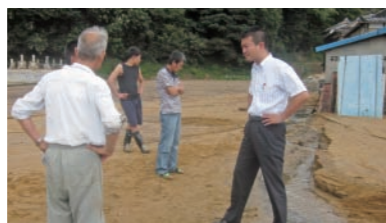
台風12号の生々しい爪あとを視察@久々井。