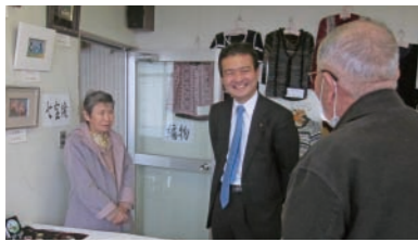
上南公民館まつりは、地域の皆さんの力作ぞろいでした。