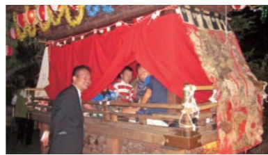
北浦地区の立派なだんじりは、夜遅くまでにぎやかに。