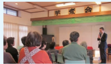
磯上の芋煮会でご挨拶。アツアツの芋煮を頂きました。