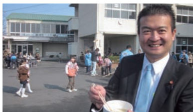
旭竜学区餅つき大会で、おいしいお餅を頂きました。