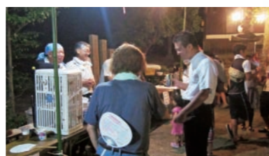
毎年温かくおもてなし頂く、奥迫川の夏祭り。