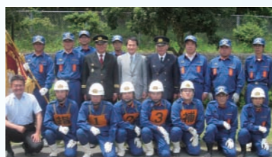
長浜分団の皆さん、お疲れ様でした！