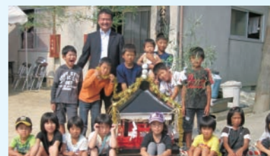
沼のお祭り。すっかり長居してしまいました。