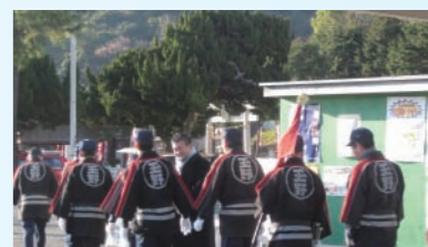
消防団の皆さんとは、新人時代からのお付き合い。