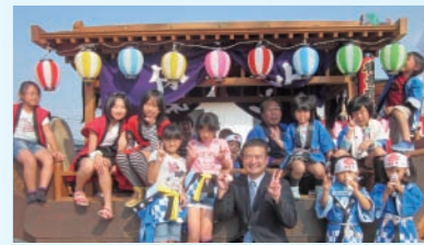
尾張地区のだんじりは、元気な子どもたちがいっぱい！