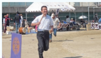
笑ってますが、一生懸命走ってます!! 田井地区運動会にて。