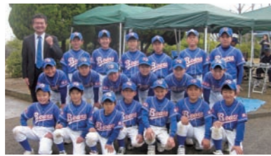
今年で35周年の芥子山ベアーズ。子どもたちの目、キラキラです。