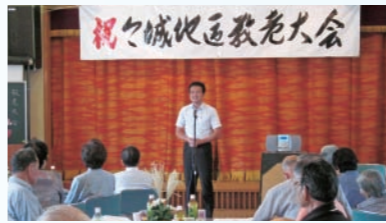
毎年、各地の敬老会におじゃましています。