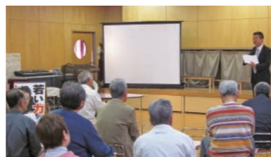
浮田・城東台学区で懇談会。たくさんご意見を頂きました。