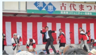
須恵古代祭りで餅投げ。遠くの方まで届くように。