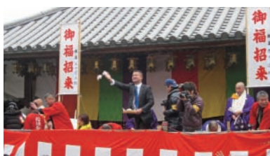
松林寺子ども会陽でも「餅投げ」。