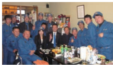
消防団雄神分団の新年会。中川雅子県議も一緒に盛り上がりました！