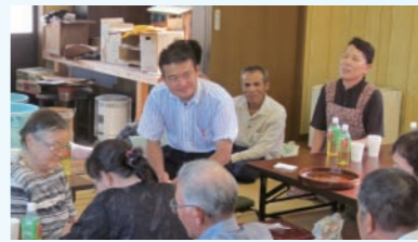
裳掛地区の町内会の集まりでは、色々なお話が聞けました。