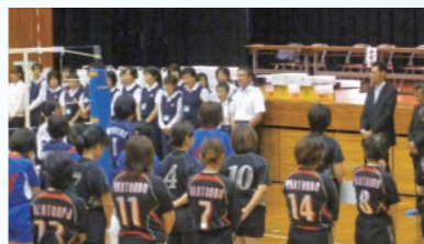
玉野はバレーボールが盛んです！