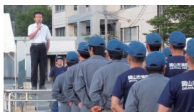
瀬崎町消防団伝統の「水出し操法訓練」。