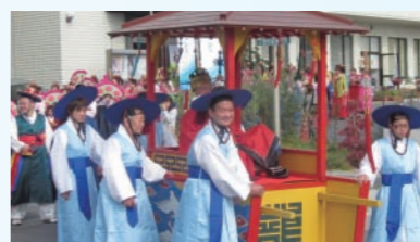
牛窓の歴史を肌で感じた「朝鮮通信使行列」。