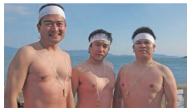
安仁神社の祓。極寒の宝伝の海に入り、諸願成就を祈りました。