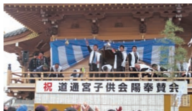
沖田神社子ども会陽。真新しい拝殿から「餅投げ」です。