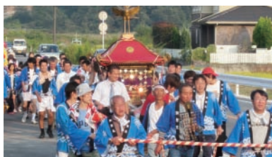
古都南方地区のお神輿。にぎやかな大行列でした。