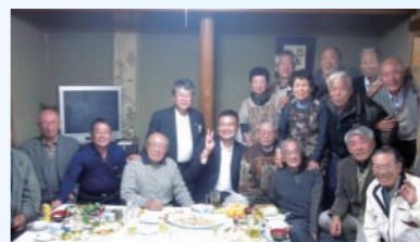
町内会の集まり。いつも貴重なご意見を頂きます。