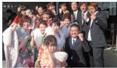
瀬戸内市成人式には毎年欠かさず出席しています。今年で9回目！