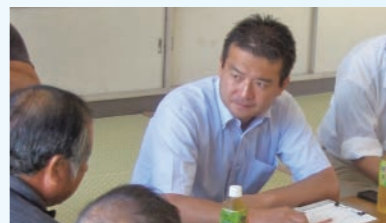
石島の火災①。町内会のご要望を聞き取り。