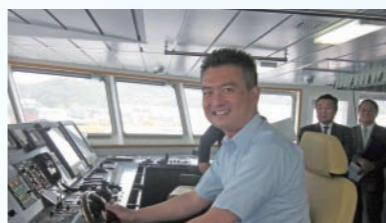
テクノスーパーライナーの操縦席。このあと被災地・石巻へ。