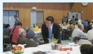
鹿忍ふれあいまつりで地域の大先輩とお話。