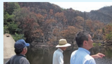
石島の火災②。現場を視察。まだ煙がくすぶっていました。