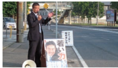
神崎町交差点で朝の演説。毎回たくさんの方が手を振ってくださいます。